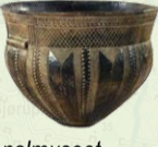
Skarpsalling-karret fra 50 kr. sedlen.

3 De Himmerlandske Heder. Resterne af de vidtstrakte hedeområder, der i 1800-tallet dækkede store dele af Vesthimmerland. Selv om hederne i dag fremtræder som et øde og ubeboet område, findes der masser af kulturspor i form af gravhøje, jernalderens marksystemer og hulveje, der vidner om tidligere tids udnyttelse.