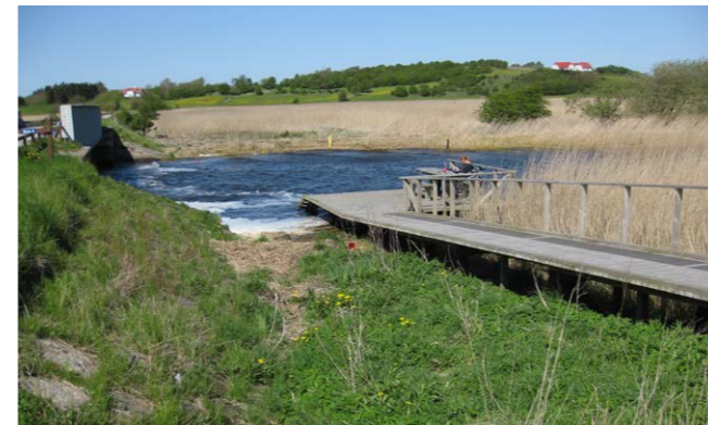
Opholdsplateau ved Skals Å

Når du cykler langs stien, er du velkommen til at benytte de mange faciliteter. Det er blandt andet rasteplasser med borde og bænke, "Grønne Landsbyrum", naturbaser, shelters, bålhytter, toiletter, små og store informationstavler og fortællebænke. På kortet kan du se, hvor de er. Du kan også se, hvor der er andre naturseværdigheder, overnatningsmuligheder og indkøb.