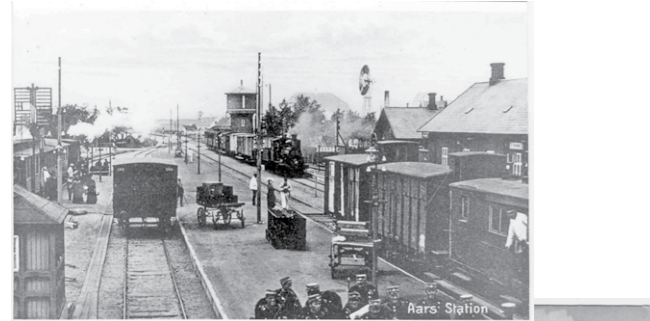
Øverst Aars Station, 1914 og nederst ses Aalestrup Station fra 1910.

Samtidig med banen blev der oprettet 12 stationer og 1 trinbræt. Stationerne var til både passagerer og godstransport. Trinbrættet kun til passagerer. Senere kom yderligere 5 trinbrætter.