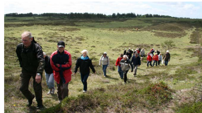
De Himmerlandske heder

Ved Oudrup Hede syd for Vindblæs følger stien en markant grænse mellem vidt forskellige naturtyper. Mod nordøst rejser den fredede Oudrup Hede sig på et kæmpemæssigt lyngklædt bakkeparti. Mod sydvest er der udsyn over frodige moser og enge. Kildevandet springer frem ved hedebackens fod og samles i Herredsbækken, som er den væsentlige vandforsyning til den 450 ha store Vilsted Sø, 5 km længere vestpå.