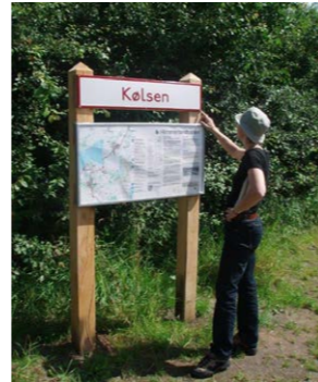
Informationstavle ved Kølsen Trinbræt

Oprindeligt var der på strækningen 5 trinbrætter og 4 stationer. For at markere, hvor der tidligere var trinbræt eller station, er der opsat infotavler med et lokalitetsskilt i det oprindelige design. Alle tavler har en QR-kode, så du på stedet kan læse mere om Himmerlandsstien.